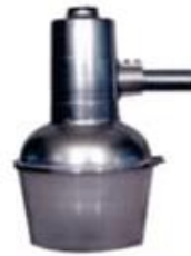
LUMINARIA SUBURBANO SUGB