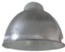
CAMPANA DE ACRILICO CON CANOPE