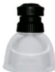
CAMPANA DE LED