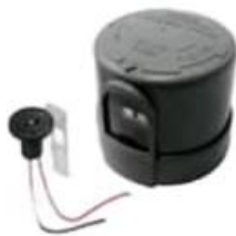
FOTOCELDA Y RECEPTACULO