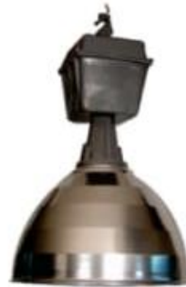
CAMPANA DE ALUMINIO CON CAJA INDUSTRIAL 14" 18" 21"