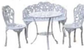
SALA DE JARDIN