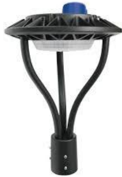
Punta de Poste SI