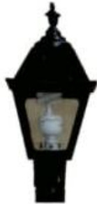
FAROL COLONIALITE LPP-C