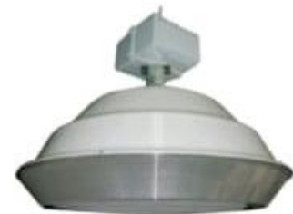
LUMINARIA MAXIFLEX 22" Y 30" LMX