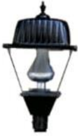
FAROL COLONIAL HACIENDA LPP-HG