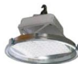
LUMINARIA DE LED