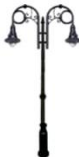
POSTE MOD. RIZO JC