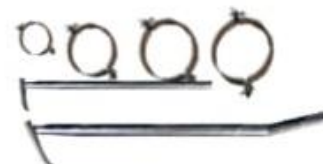
BRAZOS Y ABRAZADERA