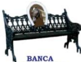
BANCA DE CABALLO