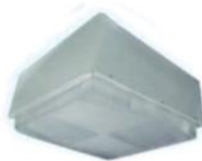
PEMEX LITE 12" X 12" Y 20" X 20" LPA