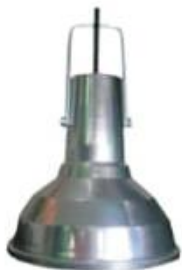
CAMPANA A-10 CA10