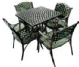
JUEGO DE JARDIN MOD. PETATILLO