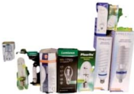
FOCOS HID Y AHORRADORES