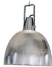
CAMPANA DE ACRILICO CON PIPTEL 12" 16" Y 22" CAP