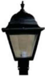
FAROL HACIENDA MED. LPP-HM