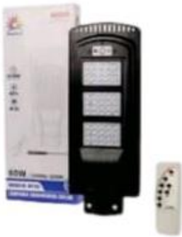
LED TODO EN UNO