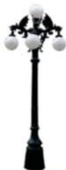
POSTE MOD. DRAGON