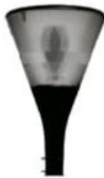
LUMINARIA FUTURA LPF