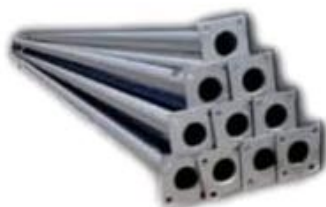
POSTE CÓNICO CIRCULAR