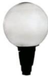
ESFERA AUTOBALASTADA LPPE