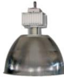
CAMPANA INDUSTRIAL DE ACRILICO 12" 16" Y 22" CAIA