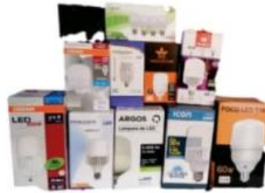
FOCOS DE LED