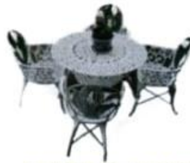
JUEGO DE JARDIN MOD. ALCATRAZ