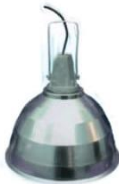
CAMPANA ALUMINIO A-14 A-18 A-21 CALP