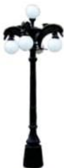
POSTE MOD. DELFIN