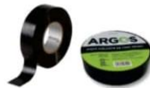
CINTAS DE AISLAR