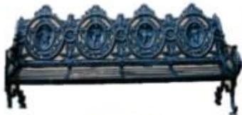
BANCA MOD. 4 MEDALLONES