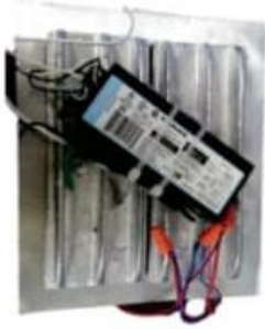
DRIVER Y TABLETAS LED