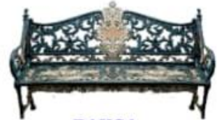
BANCA MOD. VIENA