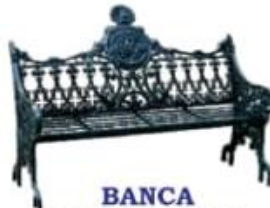
BANCA DE REPUBLICA