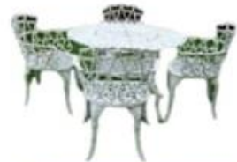
JUEGO DE JARDIN