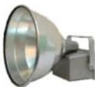
PROYECTOR CIRCULAR AUTOBALASTRADO 14", 18" Y 21" PCA