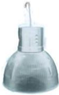
CAMPANA DE ACRILICO CON CANOPE 12" 16" CAC